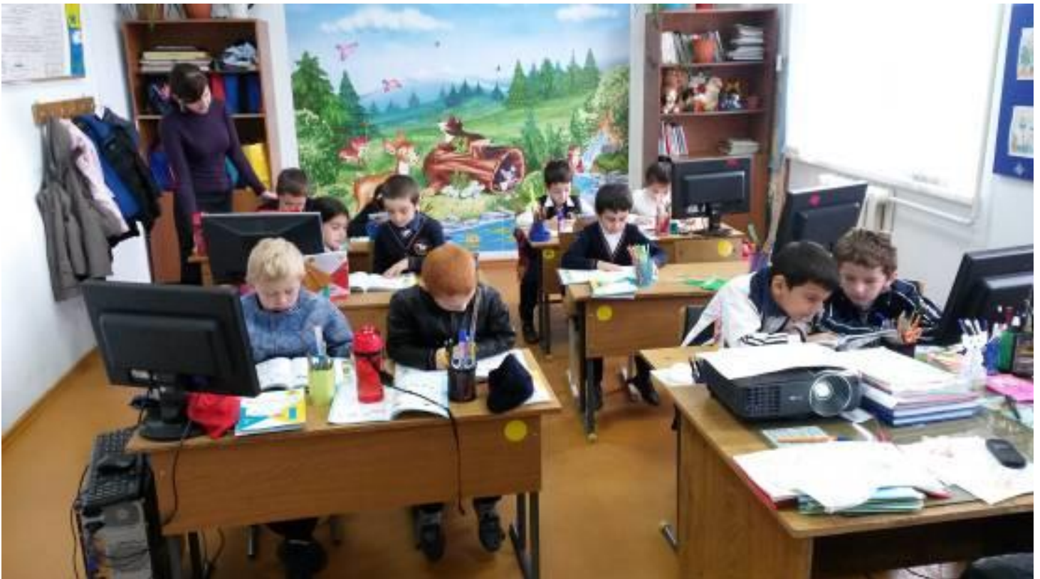
Ол ой общественности